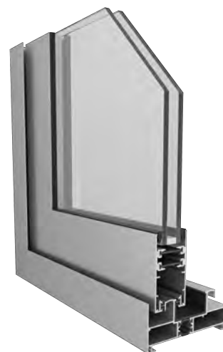
Ventana y puerta corrediza

Aluar es calidad, diseño y respeto por el medio ambiente.