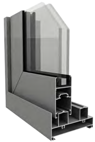
Ventana corrediza alzante Gos-s

Aluar es calidad, diseño y respeto por el medio ambiente.