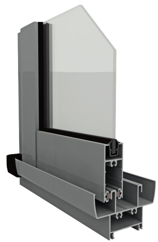
Ventana y puerta corrediza

Aluar es calidad, diseño y respeto por el medio ambiente.